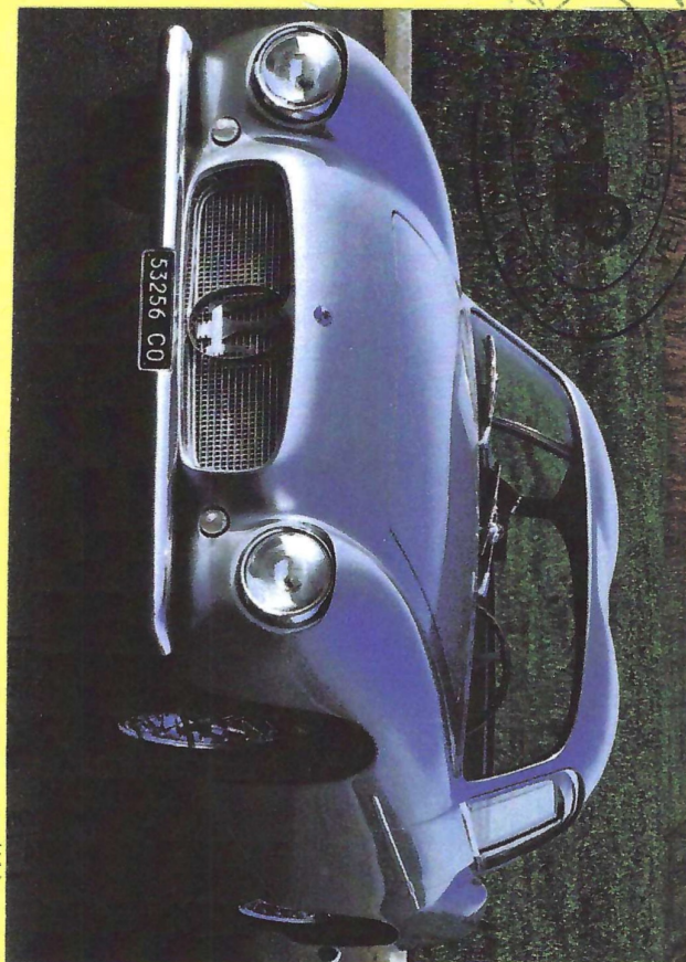
Photograph of vehicle in present form. Edge must be over stamped. Le tampon doit déborder de la photo du véhicule dans sa forme présente

Remarks, modifications, history, etc - see page 4. Remarques, modifications, histoire, etc - voir page 4.